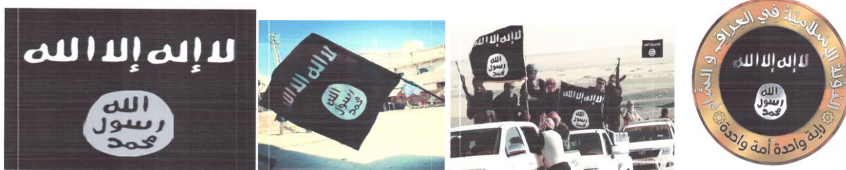
Рисунок 12. Символика организации «Исламское государство».