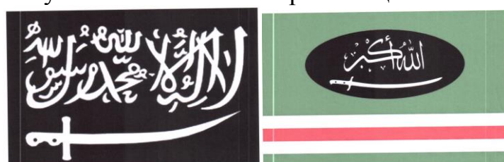
Рисунок 14. Символика вилайетов (административно-территориальных образований) организации «Кавказский эмират» («Имарат Кавказ»).

Отсутствие осознания общественной опасности террористических проявлений подростком может выражаться в наличии в публикациях на его странице или странице его друзей, а также страницах сообществ (групп), в которых он состоит (на которые подписан), информационных материалов, оправдывающих совершение преступлений экстремистской и террористической направленности, в том числе на территории зданий органов государственной власти и местного самоуправления.