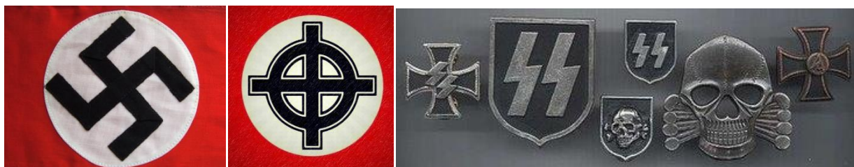
Рисунок 10. Нацистская атрибутика и символика.

Атрибутики, символики запрещенных в Российской Федерации экстремистских и террористических организаций: