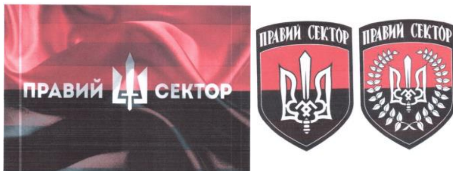
Рисунок 11. Атрибутика организации «Правый сектор».