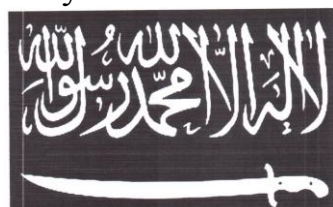
Рисунок 13. Символика организации «Кавказский эмират» («Имарат Кавказ»).